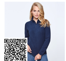
HIMALAYA WOMAN SM1096