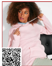
URBAN WOMAN SU1068