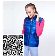
MONTANA WOMAN RA5084