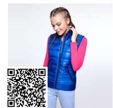
MONTANA WOMAN RA5084