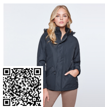
EUROPA WOMAN PK5078