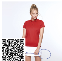
MONZHA WOMAN PO0410