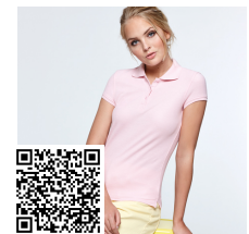
STAR WOMAN PO6634