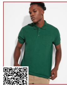
CENTAURO PREMIUM PO6607