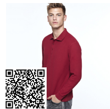
ESTRELLA L/S PO6635