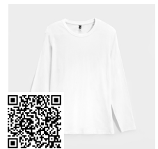
SOUL L/S R12510