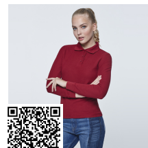
ESTRELLA WOMAN L/S PO6636