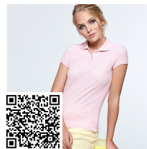
STAR WOMAN PO6634