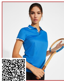
TAMIL WOMAN PO0409