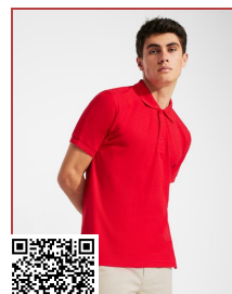
FEGASO PREMIUM PO6609