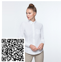
OXFORD WOMAN CM5068