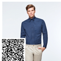
AIFOS L/S CM5504