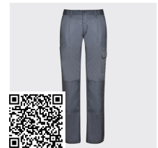
DAILY WOMAN PA9118