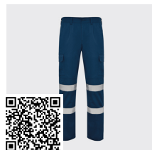
DAILY HV HV9307