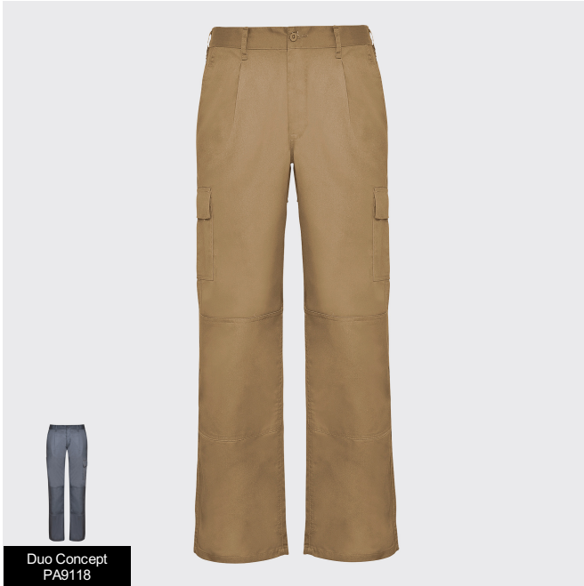
Duo Concept PA9118