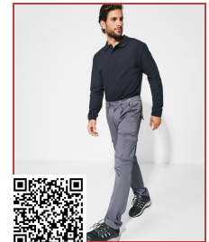
DAILY STRETCH PA9205