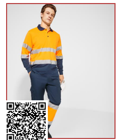
DAILY STRETCH HV HV9312