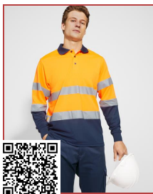
POLARIS L/S HV9306