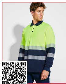
VEGA LS HV9316