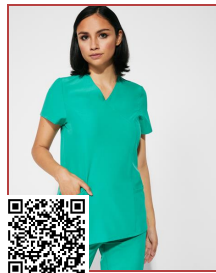
FEROX WOMAN CA9084