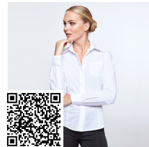
SOFIA L/S CM5161