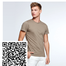
DOGO PREMIUM CA6502