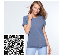
HUSKY WOMAN CA6691