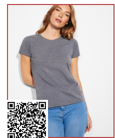
FOX WOMAN CA6661