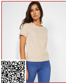
VEZA WOMAN CA6563