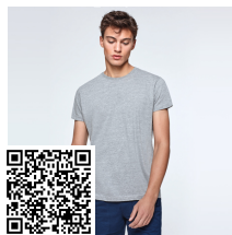
ATOMIC 150 CA6424